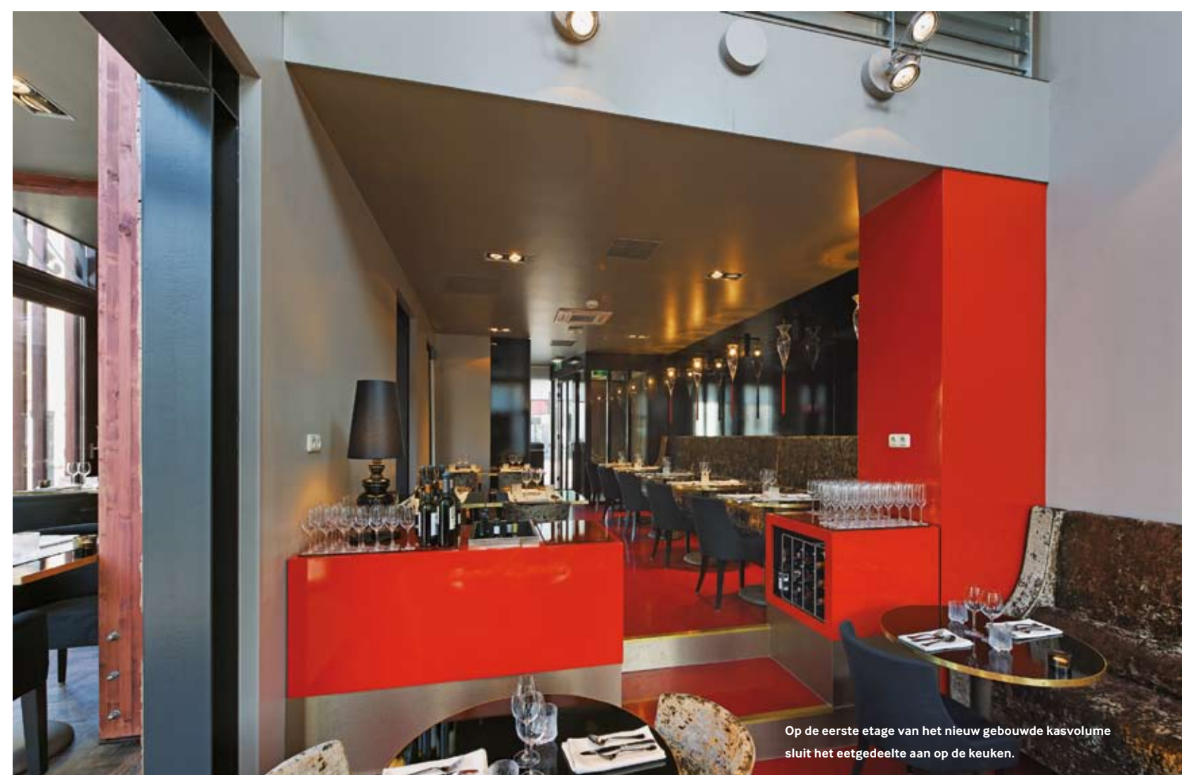
Op de eerste etage van het nieuw gebouwde kasvolume sluit het eetgedeelte aan op de keuken.

Meer beelden van dit project zijn te vinden op www.deArchitect.nl/projecten