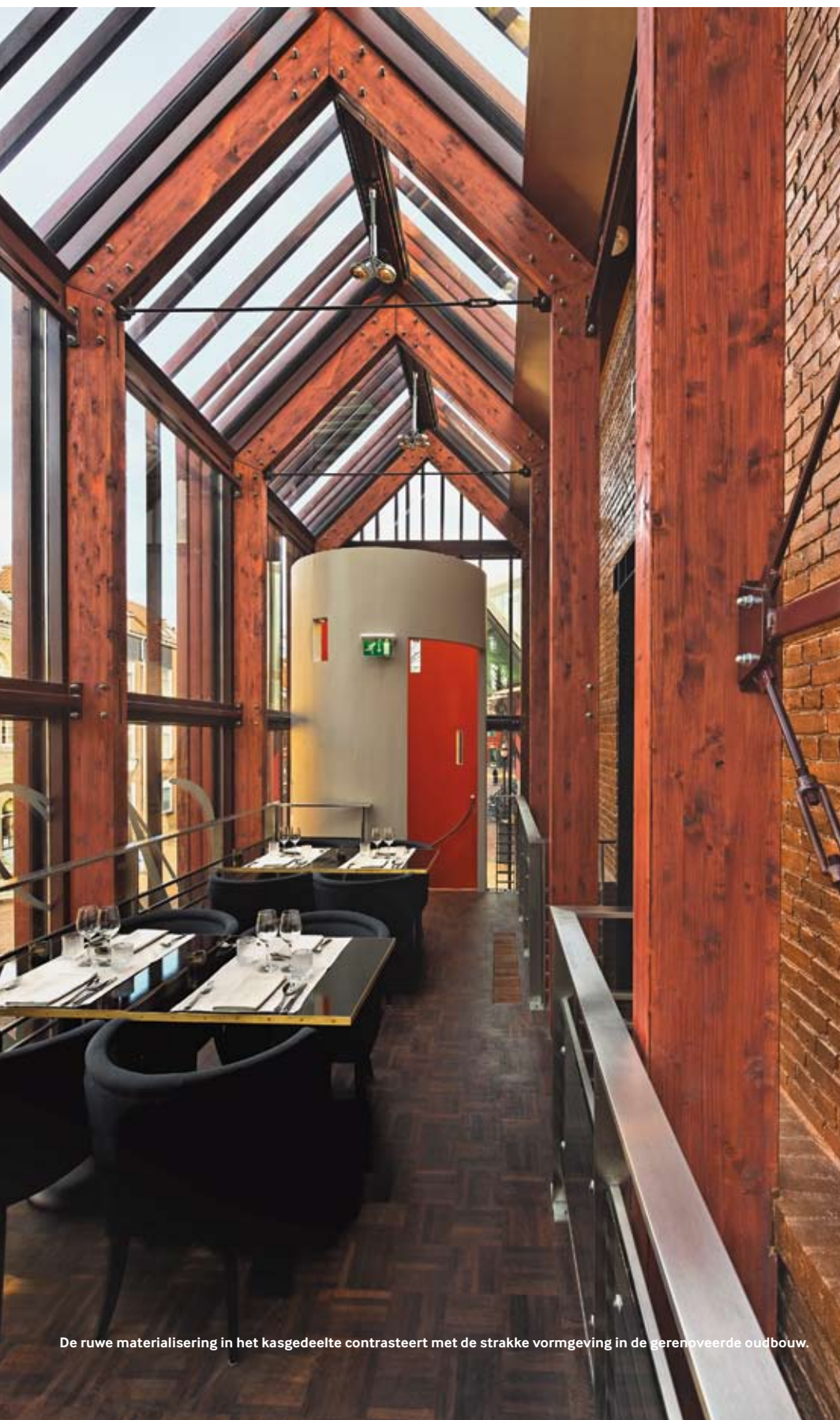
De ruwe materialisering in het kasgedeelte contrasteert met de strakke vormgeving in de gerenoveerde oudbouw.

De Delftse vestiging van restaurant Maxime ligt ingeklemd tussen de historische binnenstad en de Zuidpoort, een gebied dat de afgelopen jaren intensief is herontwikkeld. Reeds in 1995, toen de eerste plannen voor Zuidpoort het levenslicht zagen, was de gemeente zich bewust van het vitale belang van het stuk grond aan de Asvest en verwierf er drie kavels. Op twee ervan stonden kleine grachtenhuizen, het derde kavel was onbebouwd. Oorspronkelijk won Bureau Kroner de prijsvraag van de gemeente met een ontwerp voor een wijnbar. Toen de plannen in de definitieve ontwerpfase waren, haakte de ontwikkelaar af, en in zijn kielzog ook de beoogde exploitant van de wijnbar. Er werd een nieuwe ontwikkelaar/aannemer gevonden die het prijsvraagplan wilde uitvoeren. Na een korte zoektocht werd Maxime aangetrokken als nieuwe uitbater. Het veranderde programma vroeg om een lichte wijziging van de plannen, maar de hoofdopzet bleef overeind. Een glazen kas met een archetypische vorm is aan het uiteinde van de rij woningen geplaatst, op het punt waar enkele zicht- en verkeersassen vanuit de binnenstad en de Zuidpoort elkaar kruisen. De gevels en het dak zijn bekleed met lamellen van natureel geolied purperhart, die de relatie tussen interieur en omgeving door een subtiel filter halen. Overdag trekt de bijzondere detaillering de aandacht, terwijl het volume 's avonds een bijzonder licht verspreidt.